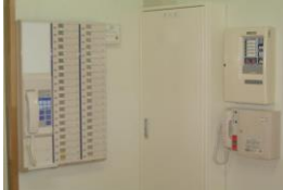
(緊急時の対応も万全)