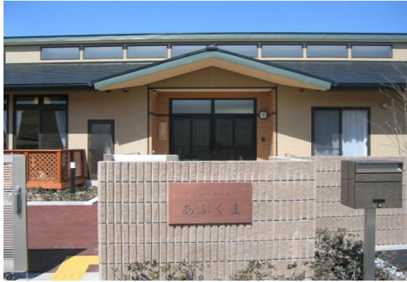
(グループホームあぶくま玄関)