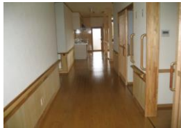
(手すりのある明るい廊)