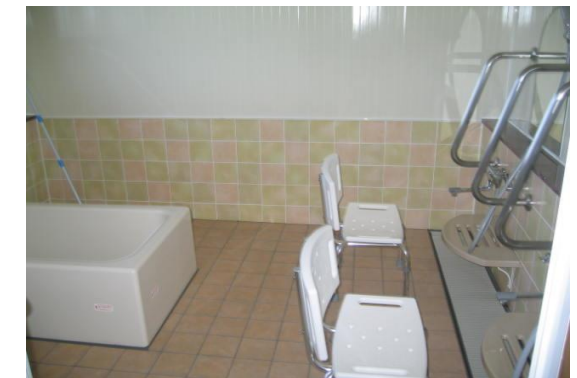
(安心して入れる浴室)