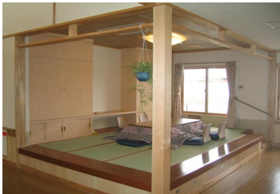
(会話が弾む掘りこたつの談話室)