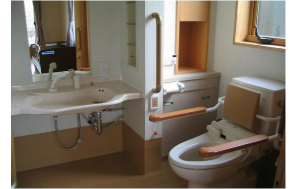
(各居室にあるトイレ・洗面所)