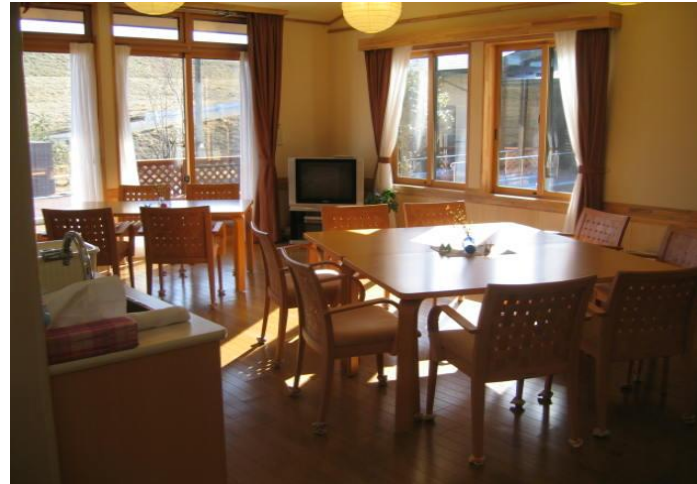
(日差しが差し込む明るいリビング兼食堂)