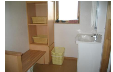
(床暖房完備の脱衣室)