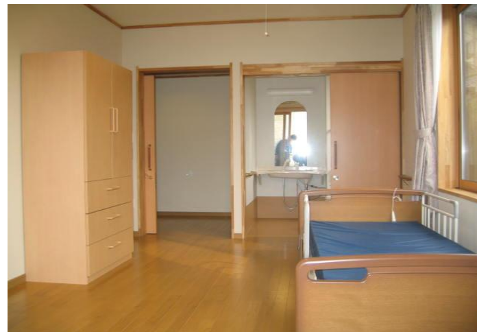
(のんびりと過ごせる個室)