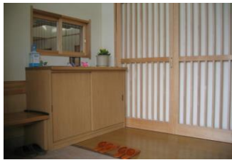
(バリアフリーの明るい玄関)