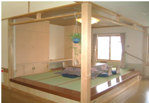
(会話が弾む掘りこたつの談話室)