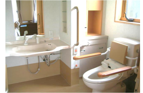
(各居室にあるトイレ・洗面所)