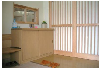
(バリアフリーの明るい玄関)