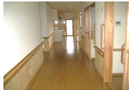
(手すりのある明るい廊)