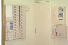
(緊急時の対応も万全)