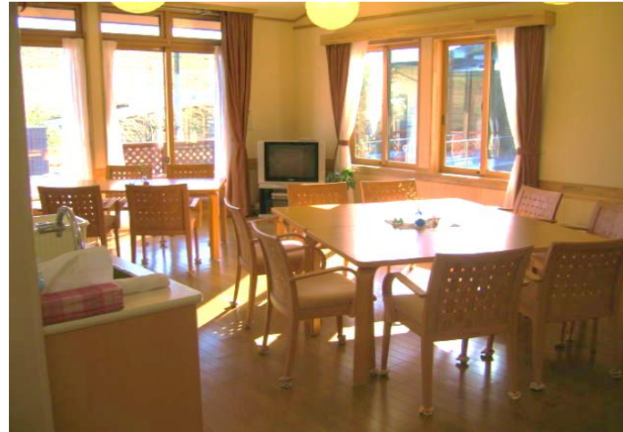
(日差しが差し込む明るいリビング兼食堂)