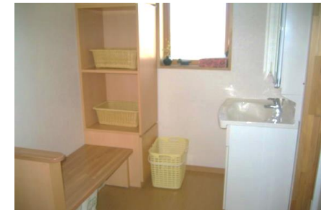
(床暖房完備の脱衣室)