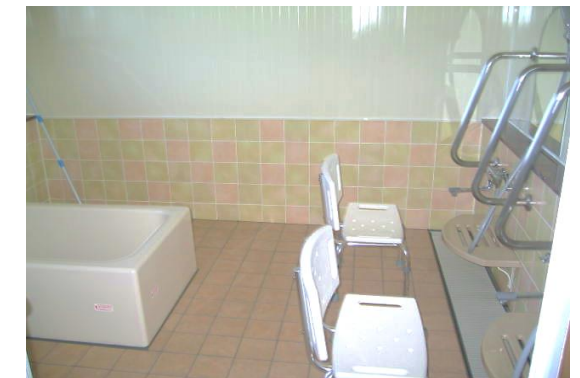
(安心して入れる浴室)