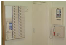
(緊急時の対応も万全)