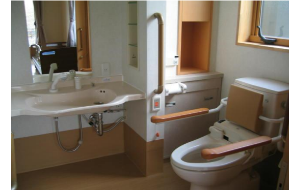
(各居室にあるトイレ・洗面所)